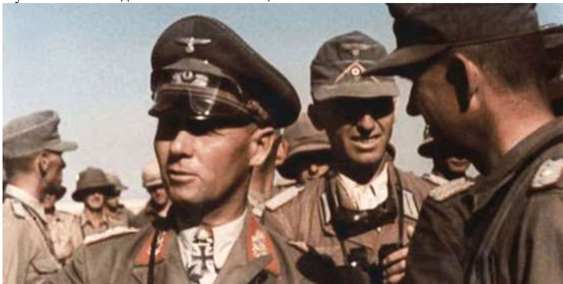
Генерал-лейтенант Эрвин Роммель в Ливии, 1942 год

А потом англичане остановились: им еще нужно было отправить войска в Грецию. Пришла очередь итальянцев использовать сберегательное перемирие и воспользоваться опцией «позвонить другу». В отличие от балканских приключений Муссолини, Гитлер считал свои планы в Северной Африке вполне разумными и немедленно оказал помощь.